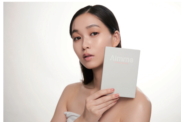
超高密度炭酸パック 『Aimmeイメージモデル』