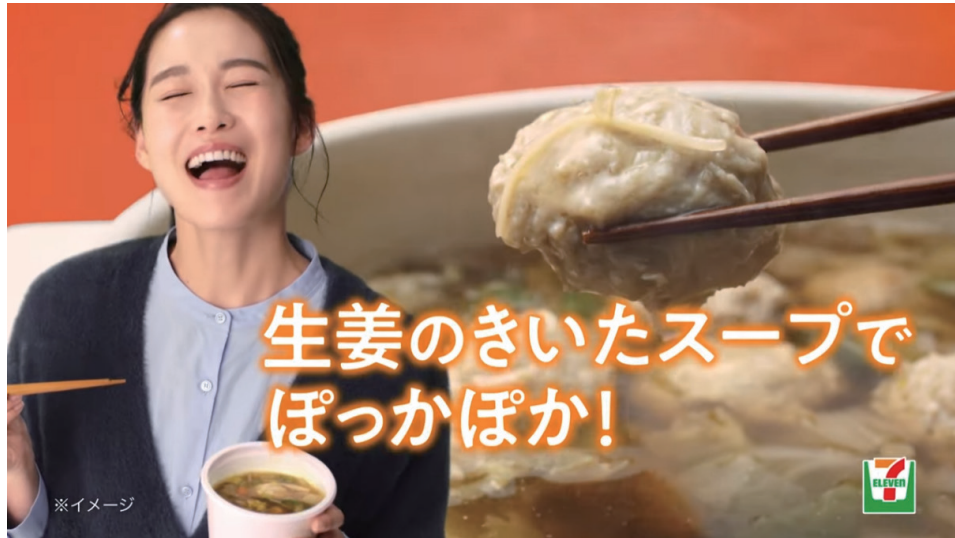
セブンイレブンTV-CM「あったかスープ&鍋」 2023.11月~CM出演中