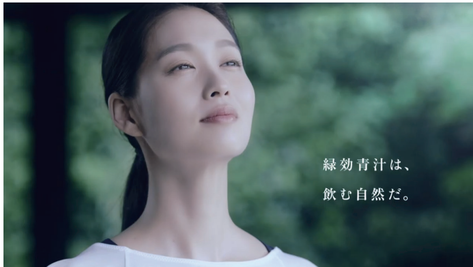
アサヒ緑健TV-CM 緑効青汁『品質訴求』 2023.9月~CM出演中