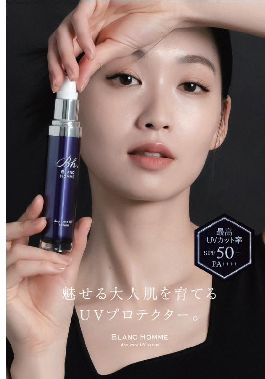
BLANC HOMME 広告イメージモデル2023 雑誌「GINGER」レギュラーモデル出演中