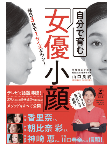
自分で育む「女優小顔」 モデル出演